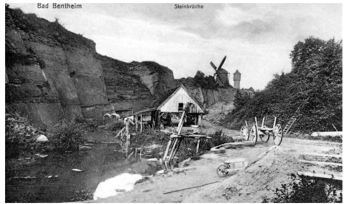
Schlüters Kuhle (um 1910)

Im Jahre 2011 wurde die alte Steinhauerhütte am Eingang der Kuhle restauriert. Das Steinhauerhandwerk soll hier durch Aktionen in Zusammenarbeit mit dem Sandsteinmuseum und der Jugendherberge wieder belebt werden.