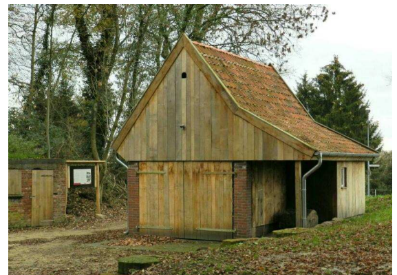
restaurierte Steinhauerhütte 2011